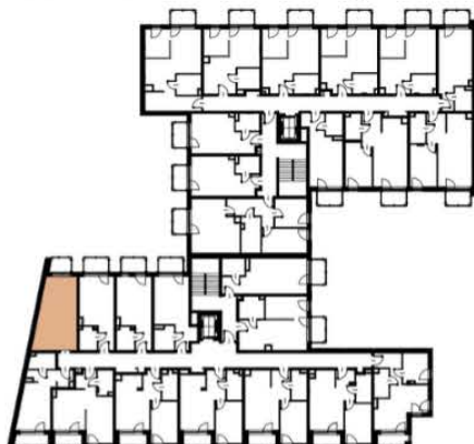
Położenie lokalu w budynku