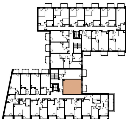
Położenie lokalu w budynku