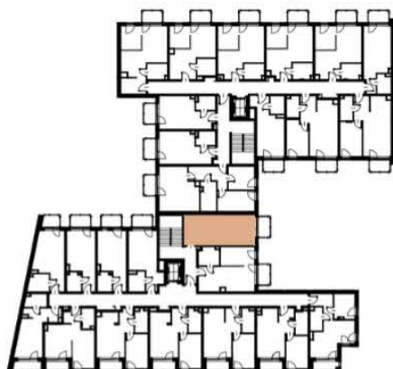
Położenie lokalu w budynku