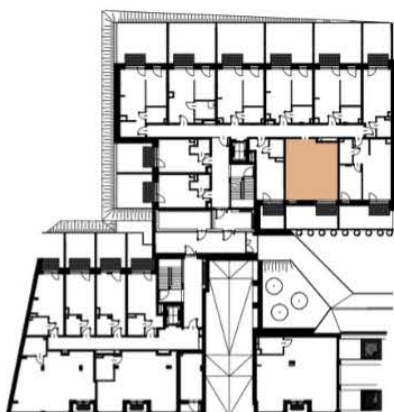
Położenie lokalu w budynku