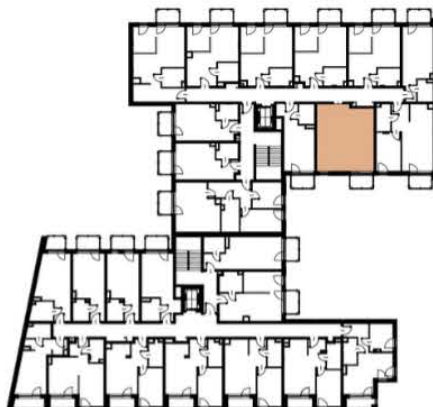
Położenie lokalu w budynku